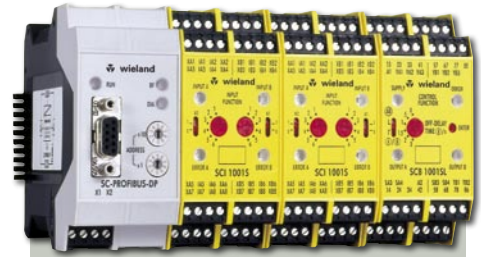
Przykład systemu Safety Center

Center jest tańsze niż budowa obwodów z pojedynczych przekaźników bezpieczeństwa. Moduły Safety Center mogą być łączone w zestawy zawierające moduł podstawowy SCB i od 1 do 4 modu-